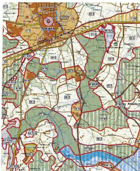
3.1.1. pav. Rokiškio rajono savivaldybės teritorijos bendrasis planas, Žemės naudojimo, tvarkymo ir apsaugos reglamentų brėžinys.

Planuojamoje teritorijoje galioja Rokiškio rajono savivaldybės teritorijos bendrojo plano sprendiniai (3.1.1. pav.).